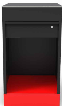
* widok od strony operatora